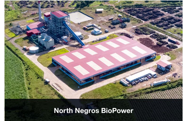
North Negros BioPower