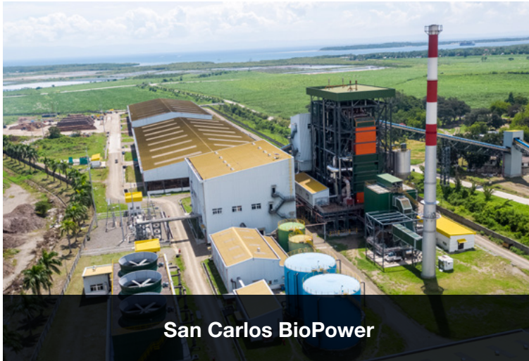
San Carlos BioPower