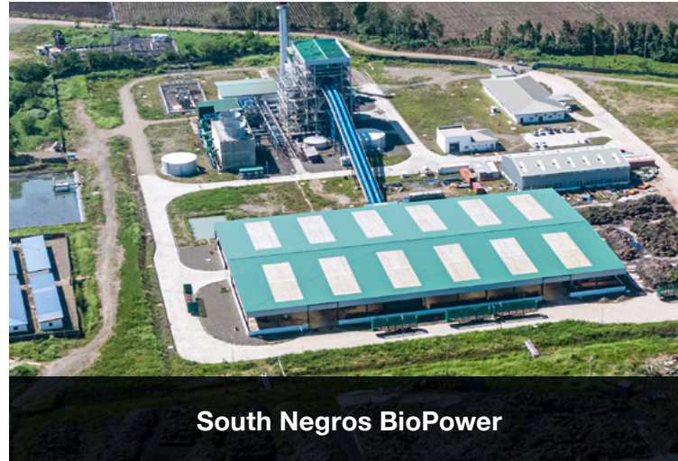
South Negros BioPower